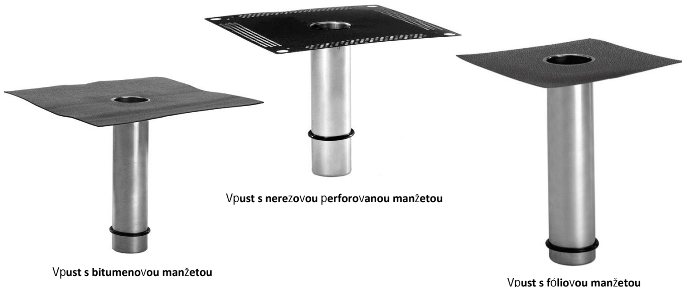
Vpust s bitumenovou manžetou